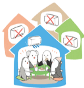
ご近所でクールシェア

自宅のエアコンを止め、ご近所のお宅に集まってご近所同士のコミュニティを深めよう。