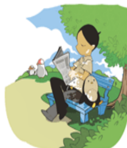
自然でクールシェア

自宅のエアコンを止め、ご近所のお宅に集まってご近所同士のコミュニティを深めよう。