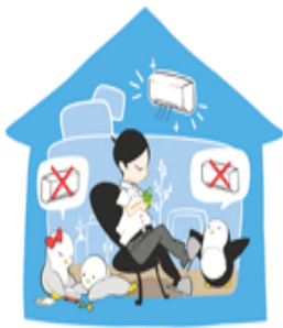
おうちでクールシェア

例えば3台のエアコンをつけていたら2台を止め、1部屋に集まり家族団らんで過ごそう。