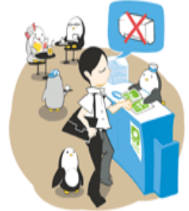
まちでクールシェア