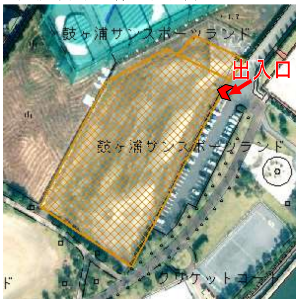
(施設平面図 第一駐車場)