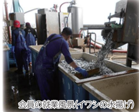
会員の就業風景(イワンの水揚げ)

屋外広告物は、まちの景観をつくる重要な要素です。良好な景観を保全するために、適切な屋外広告物の設置にご協力ください。