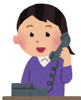
「市民の声」受付方法

市ホームページ(📄 https://www.city.suzuka.lg.jp/ )の「市への意見・質問」内の「市民の声」をご利用ください。