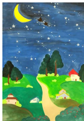
天栄中1D 向井 結虹 「緑がいっぱいで 星がきれいなまち」