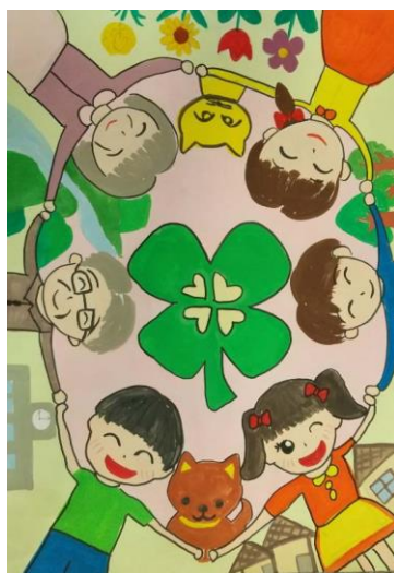
稲生小2C 田中 彩季 「みんなニコニコえがおの町」