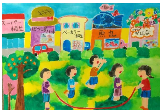
稲生小5C 磯部 蒼月 「おもしろい町いのう」