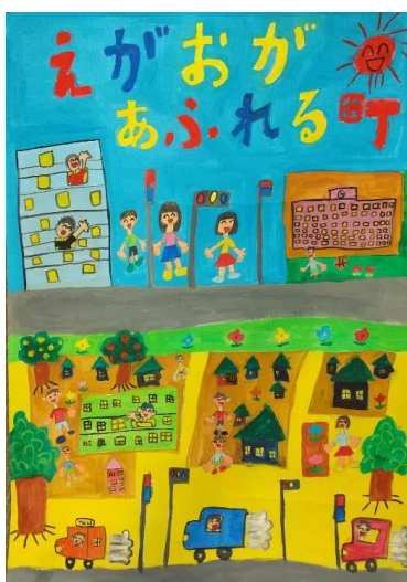
稲生小1B 浦嶋竜ノ介 「えがおがあふれる町」