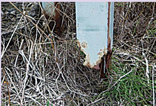
▲支柱基礎部の腐食

詳しくは、市ホームページ(🏠 https://www.city.suzuka.lg.jp/gyosei/plan/keikan/index3.html )をご覧ください。都市計画課へお問い合わせください。