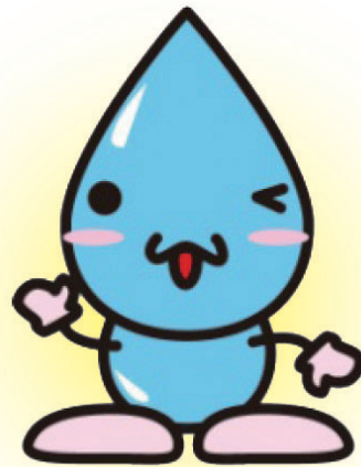
鈴鹿市の水道キャラクター すいてきくん