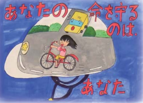
平成23年度 鈴鹿市交通安全図画ポスター入賞作品