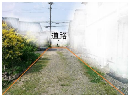
【車両出入口（接道方向）】