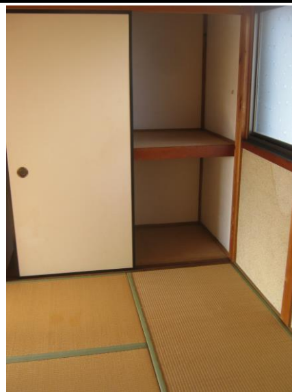
【2階 和室 (6.0畳)】