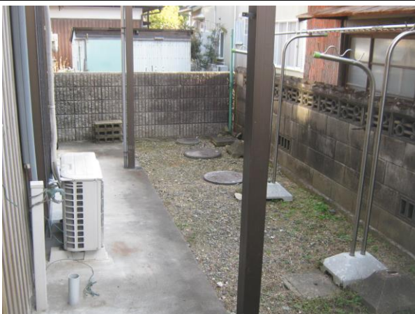
【敷地南側 (物干し場)】