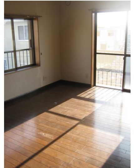
【2階 洋室 (10.0畳)】