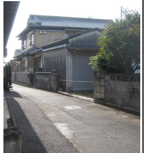
【東側道路 (北側から撮影)】