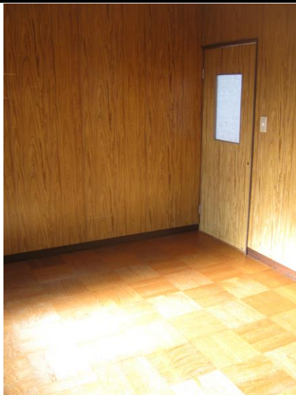
【2階 洋室 (8.0畳)】