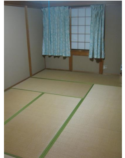
【1階 和室 (8.0畳)】