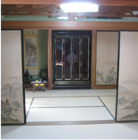
【1階 和室 (6.0畳)】