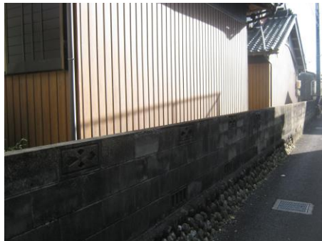
【西側外観 (ブロック塀)】