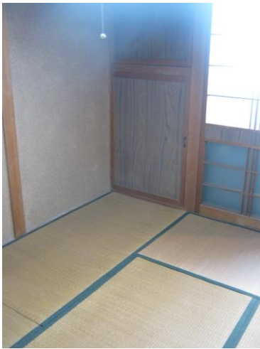
【2階 和室 (6.0畳)】