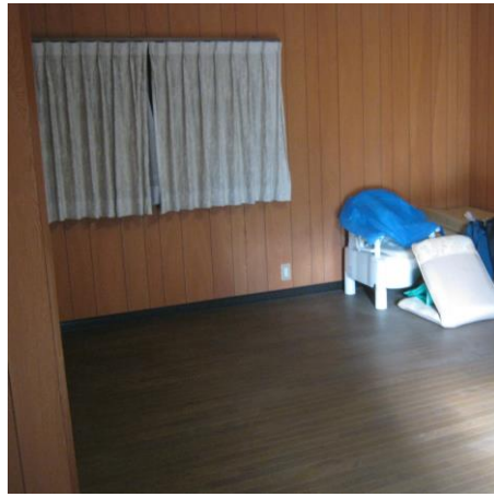
【1階 洋室 (13.5畳)】