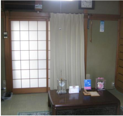
【1階 和室 (8.0畳)】