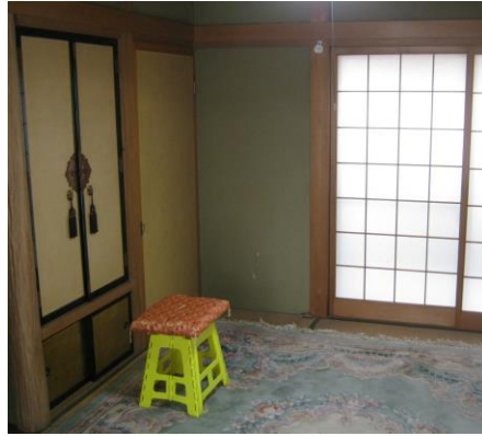
【1階 和室 (6.0畳)】