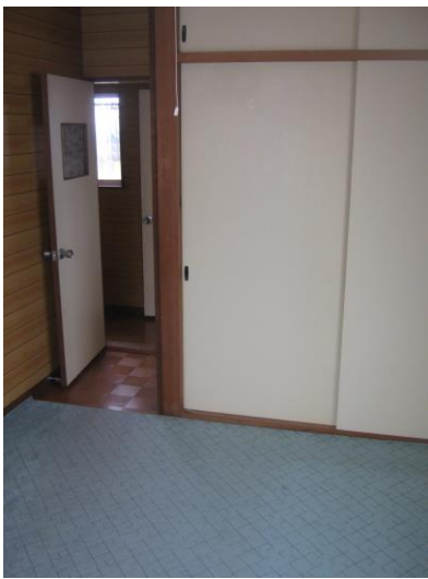
【2階 洋室 (6.5畳)】