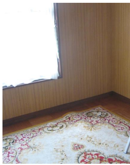
【2階 洋室 (6.0畳)】