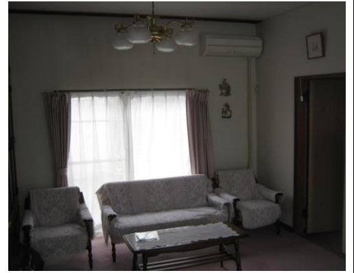
【1階 洋室 (12.0畳)】