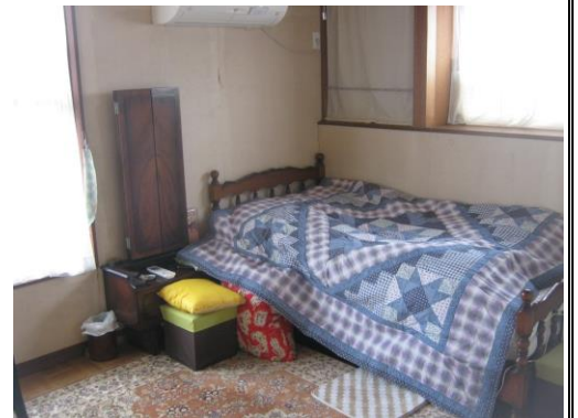
【2階 洋室 (7.5畳)】