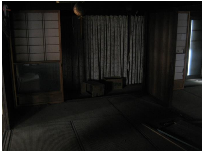
【南側 和室 (6.0畳)】