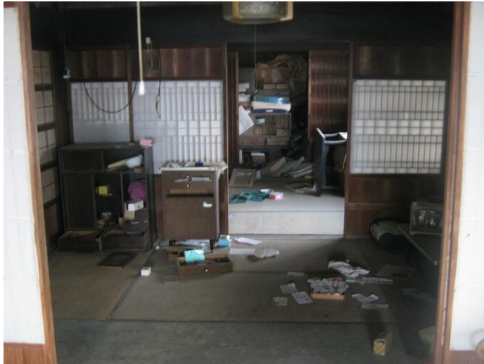
【北側 和室 (6.0畳)】