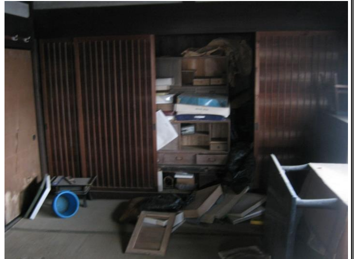
【北側 和室 (8.0畳)】