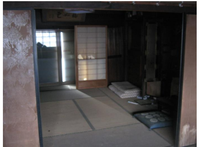
【南側 和室 (8.0畳)】