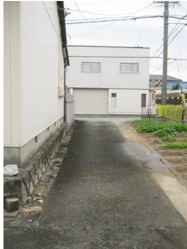
【駐車スペース進入路】