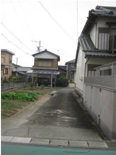
【駐車スペース進入路】