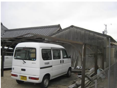
【カーポート (屋根なし)】