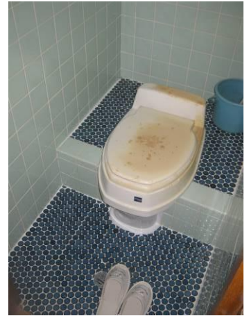
【和式 (簡易洋式) 便所】