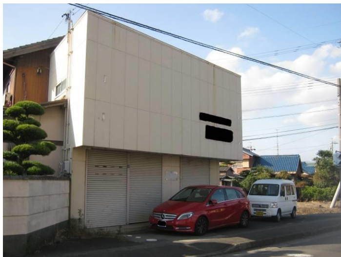
外観（店舗，駐車スペース）