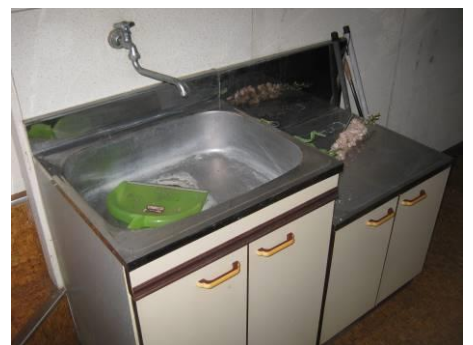
【店舗ミニキッチン】