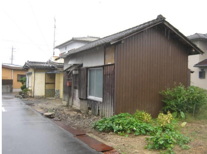
外観（奥：母屋，手前：離れ）