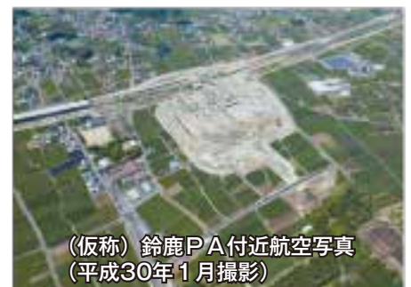
(仮称) 鈴鹿PA付近航空写真 (平成30年1月撮影)

平成30年度に開通を予定している(仮称)鈴鹿PAスマートICについて、周辺地域の活性化についての調査研究を行います。