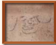
平城京跡 控えめな人 奈良市埋蔵文化財調査センター