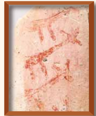
一色青海遺跡 赤い鹿 愛知県埋蔵文化財センター