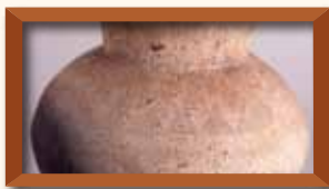
六大A遺跡 □□ 三重県埋蔵文化財センター