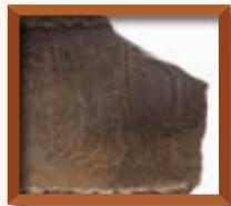
舟橋遺跡 △△ 柏原市立歴史資料館 柏原市指定有形文化財