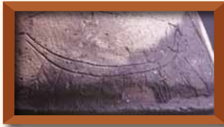
小阪合遺跡 船 八尾市立歴史民族資料館 八尾市指定文化財