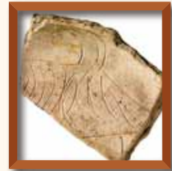
平城京跡 ○○○○ 奈良文化財研究所