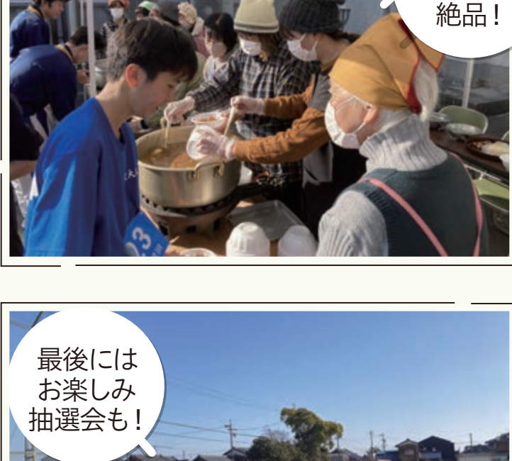
炊き出しの豚汁は絶品!