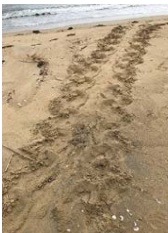
ウミガメの足跡 鼓ヶ浦海岸

問 ウミガメネットワーク三重 担当 米川 ☎090-5600-0221 ✉umigamenetmie@gmail.com