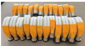
コミュニティ助成事業で整備された消防用ホース

宝くじの社会貢献広報事業として、(一財)自治総合センターが実施するコミュニティ助成事業の助成金を活用して、将来の地域防災の担い手である学生団員を育成することを目的に、消防用ホースを整備しました。