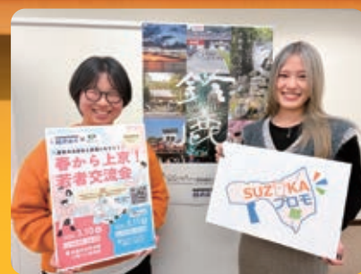
鈴鹿を盛り上げてくれる すずかプロモーション部の部員

間機関の調査で共働ぎで子育てしやすいまちとして令和4年以降連続で非常に高い評価を受けています。さらに、鈴鹿市子ども条例の理念のもと、全ての子どもが将来に夢と希望をもって生きることができるとして社会の実現を目指します。 また、本市の強みであるものづくりの技術やモータースポーツをはじめとする地域資源などを生かし、地域経済に新たな賑わいと活力を呼び込むため、その魅力を市内外に向けて積極的に発信し、シビックプライドの醸成や東京事務所を核とした首都圏での関係人口づくりをさらに進め、「選ばれるまち・鈴鹿」の実現を目指します。 DXの推進 行政のさまざまな分野で積極的にデジタル技術を取り入れ市民サービスの質を飛躍的に高め、より良い暮らしと持続可能な社会の実現に向けた変革を着実に進めてまいります。