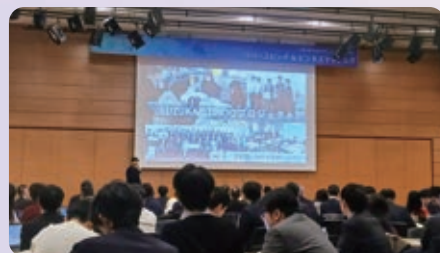
首都圏でのシティプロモーション

東京事務所を拠点に、国や民間企業、大学などのネットワークづくりを一層進めることで、移住・定住の促進や関係人口の拡大、企業誘致など、更なる経営資源の獲得に向けて戦略的に取り組みます。