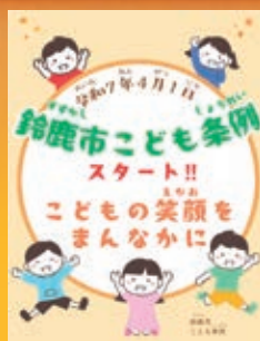
昨年4月に施行した 鈴鹿市子ども条例

は、市民の皆様が住みやすさを実感できるよう、また種を芽吹かせ大きな実りへと結びつける「飛躍の一年」にまいります。 人口減少対策 まちの活力は人にあります。次代を担う子どもたちが健やかに育ち、質の良い教育を受けられる環境を整えることは、本市の未来を支える確かな基盤づくりにほかなりません。本市は民