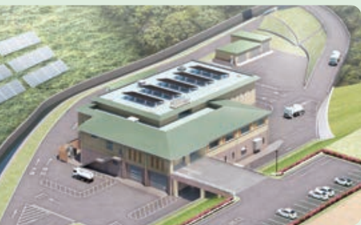
クリーンセンター完成イメージ図

現在事業を進めているクリーンセンターの整備をはじめ、斎苑の改築、清掃センター、不燃物リサイクルセンターの更新に向けて計画的な検討を行います。