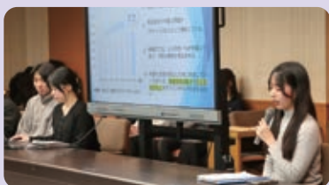
愛知大学の学生による政策提案発表

学官連携による市内の高等教育機関や包括連携協定を締結している愛知大学など、民間の視点や若い世代の発想を広く市政に取り入れながら「市民力の向上」と「行政力の向上」を図ります。