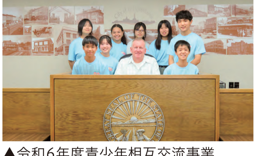
▲令和6年度青少年相互交流事業

友好都市であるアメリカ・オハイオ州ベルフォンテン市との青少年相互交流事業の参加者を募集します。現地でのホームステイ(5泊)のほか、カナダのトロントを訪問し、ナイアガラの滝や発電所を見学します。ほかにも、トロント大学キャンパスツアーなど、充実したプログラムです。これまでに456人の生徒を派遣しています。