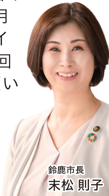
鈴鹿市長 末松 則子

がら、70年以上にわたり市政と市民の皆様をつないできた「広報すずか」は、時代とともに進化を重ねてまいりました。