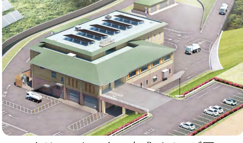
クリーンセンター完成イメージ図

現在事業を進めているクリーンセンターの整備をはじめ、斎苑の改築、清掃センター、不燃物リサイクルセンターの更新に向けて計画的な検討を行います。