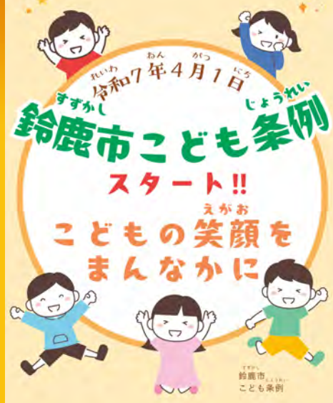
昨年4月に施行した 鈴鹿市子ども条例