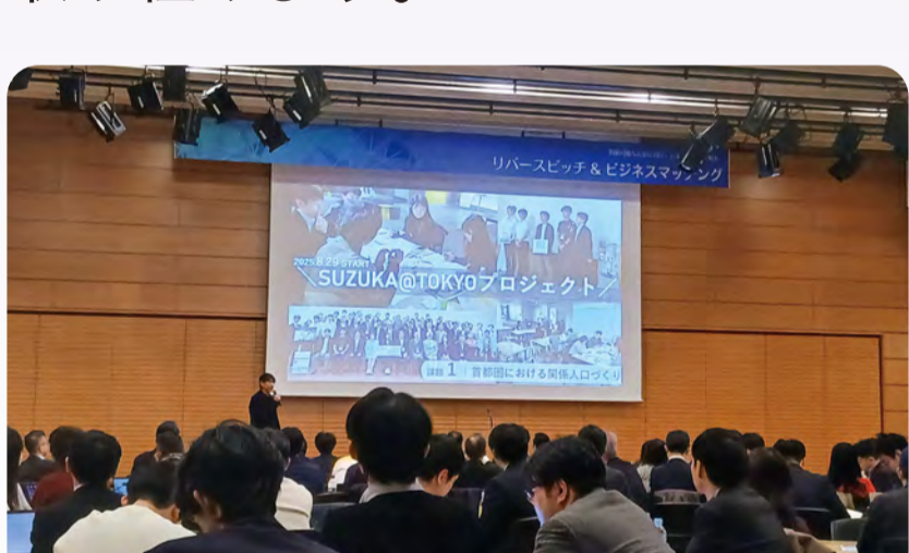
首都圏でのシティプロモーション

東京事務所を拠点に、国や民間企業、大学などとのネットワークづくりを一層進めることで、移住・定住の促進や関係人口の拡大、企業誘致など、更なる経営資源の獲得に向けて戦略的に取り組みます。