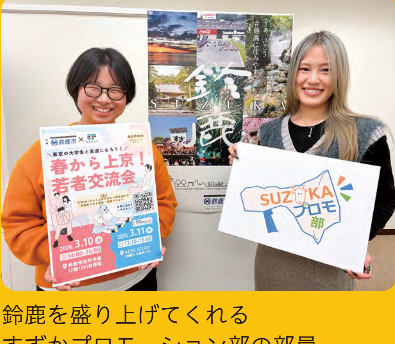
鈴鹿を盛り上げてくれる すずかプロモーション部の部員