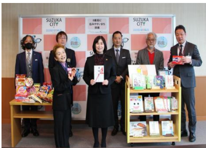
防犯ホイッスル寄贈