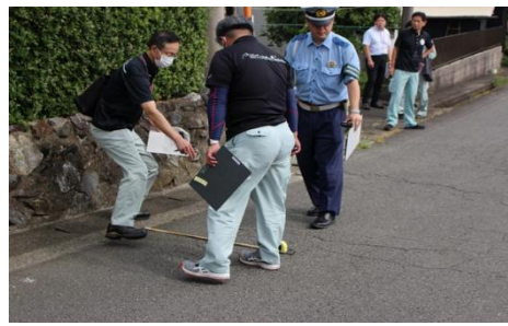
合同危険箇所点検