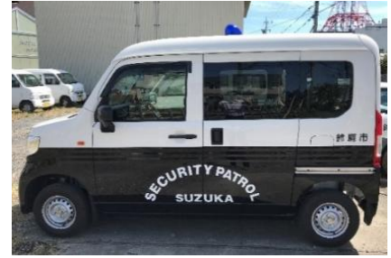
青色回転灯等装備車