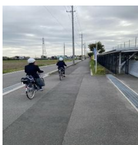
中学校あいさつ運動