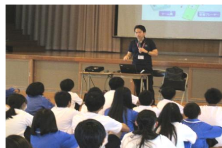
インターネットの正しい使い方 教室