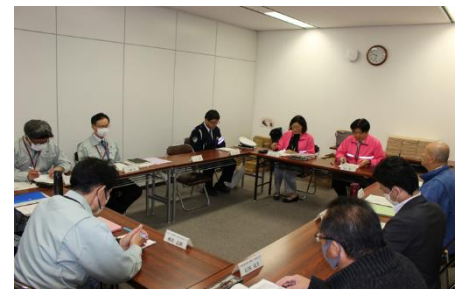
通学路危険箇所点検連絡会議