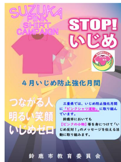
いじめ防止強化月間の チラシ配布