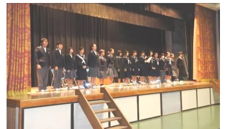
中学生ヒューマンライツサークル

市内の中学生が人権について考えたり、話し合ったりする。その内容や成果を学校へ発信し、人権を大切にする行動に結びつくようにしている。また、鈴鹿市と亀山市の生徒が参加する生徒会研修会で子どもたちが人権劇やネットワークの取組を発表する。