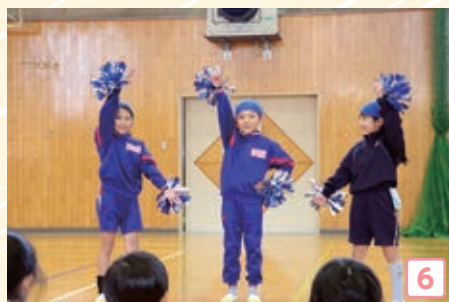
▲①②③：学校紹介 ④：合川・天名小学校の児童を迎える郡山小学校の児童 ⑤：ドッジボール ⑥：ダンスの発表