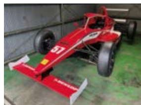
▲FJ1500マシン 「ミストKK-F」(試作車)

エンジンはトヨタ製1500cc、タイヤはダンロップ製のワンメイク(単一銘柄)となりますが、シャシー(車体)は規則に沿った形でのマルチメイク(自由競争)。本市住吉に拠点を置く「自動車工房ミスト」が先陣を切ってニューマシン「ミストKK-F」を発表し、大きな注目を集めています。今月末の「鈴鹿チャンピオンカップレース」でのデビューランにご期待ください。