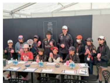
▲F1ドライバーとの交流の様子(2025年)

F1日本グランプリの開催をきっかけとして、より多くのこどもたちが、モータースポーツを通して鈴鹿市民であることに誇りを持てるよう、間近にF1を感じることが出来る「F1ドライバー交流」を実施します。