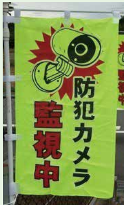
▲道路に設置したのぼり旗

自治会と個人の防犯カメラ設置に係る費用の一部を協議会が補助し、地域内の主要な出入口となる道路や、個人宅にも設置できるような制度としました。