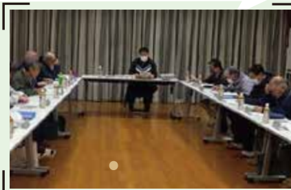
▲庄内地区地域づくり協議会代表者会議