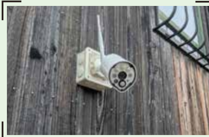
▲設置した防犯カメラ