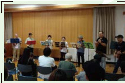
▲音楽を通して交流する「まちの音楽会」