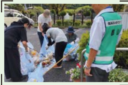
▲チームでゴミ拾いを行う「スポGOMI」