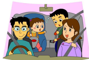
すべての座席でシートベルト