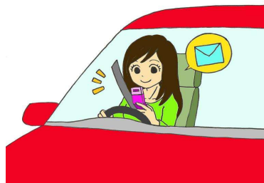
ながら運転は厳禁！