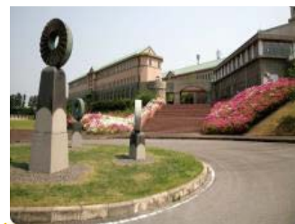
鈴鹿大学・ 鈴鹿大学短期大学部