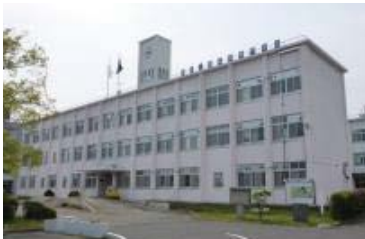
鈴鹿工業高等専門学校