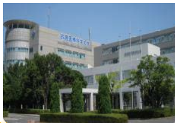
鈴鹿医療科学大学 千代崎キャンパス