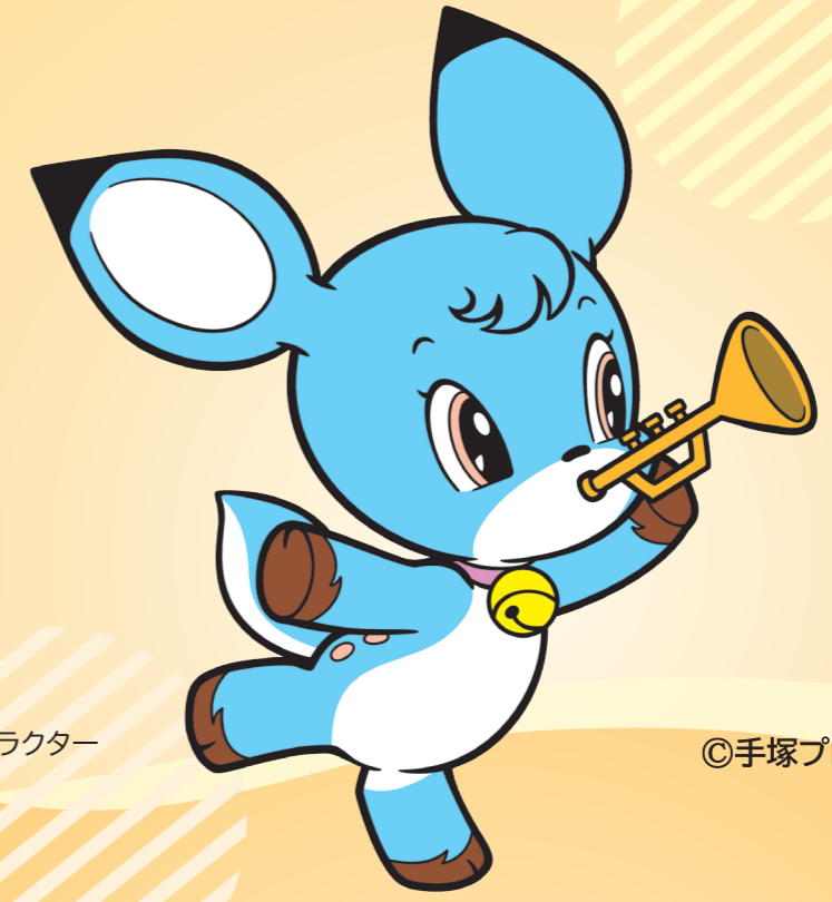
鈴鹿市 マスコットキャラクター バルディ