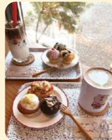
コーヒーやシェイクなどのこだわりのドリンクとセットで、イートインも楽しめます。