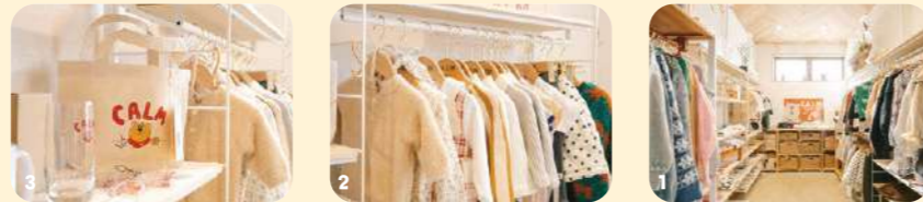
1/店舗奥には店主のセンス光るファッションや小物など、セレクトアイテムが並びます。 2/子供服のサイズは70cm〜。3/お店オリジナルの雑貨やTシャツ、トレーナーも販売。親子でお揃いの洋服もあります！