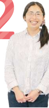
フジタさん 鈴鹿市在住歴25年以上 子ども2人(4歳、6歳)