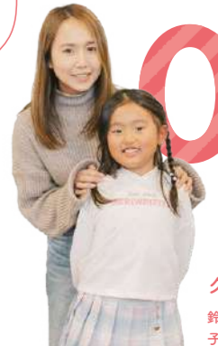
クワモリさん 鈴鹿市在住歴15年 子ども2人(7歳、4歳)