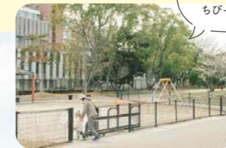
フェンスで囲まれたちびっこ広場