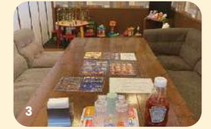
1/お店の内装もアメリカンスタイルで雰囲気たっぷりです。 2/孤野町「角屋」特注のフランクフルトを使ったホットドッグも自慢です。 3/キッズスペースを備えた子連れ向けの個室(90分制・要予約)。子ども用のイスもあり、ゆったりと寛げます。