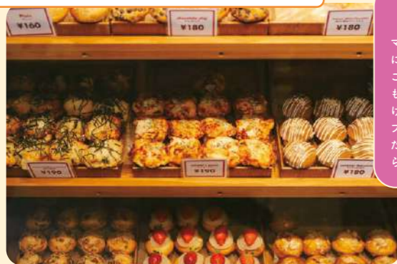
マフィンには季節により様々なフレーバーが展開します。7個入り・12個入りから選べる「muffin BOX」は、好きなマフィンを選んでラッピングも無料。手土産やお祝いにもぴったり。