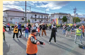
▲スタート前にしっかり準備運動

チェックポイントで写真を撮影し、チームでポイントを競うロゲイニング大会を開催。たくさんの場所を巡ることで地域を知り、子どもからお年寄りまでみんなが参加することで、地域のコミュニケーションを深めています。