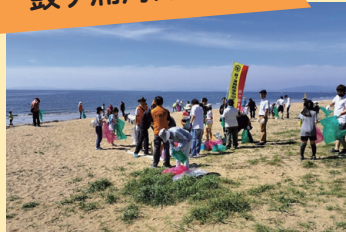
▲みんなできれいな砂浜に

きれいな砂浜を維持するため、住民みんなで実施する鼓ヶ浦海岸清掃。鼓ヶ浦小学校の児童と協力しながら、みんなが訪れたいくなるようなきれいなまちづくりに取り組んでいます。