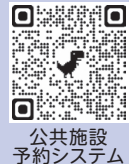
公共施設予約システム