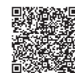
▲空き家に関する ガイドブック

公道に面する高さ1mを超えるブロック塀などの除却工事で昭和56年5月31日以前に着工された木造住宅の耐震診断などに要する経費を対象として、補助金を交付しています。