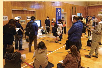
▲防災について学ぶ参加者