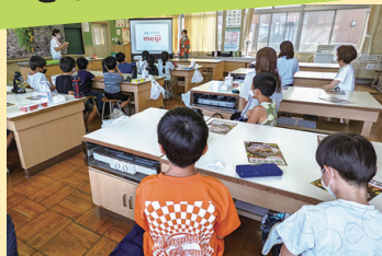
▲興味をもって話を聞く子どもたち

年8回、小学生向けに放課後を使って開催している「さかえーる教室」。門松作りやダンス体験、食品メーカー社員による講習など、さまざまな機会を提供することで、地域の子どもの育成につながっています。