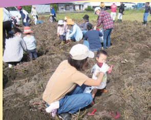
▲お芋がいっぱい採れました

サツマイモの植え付けや収穫の体験により、地域の皆さん同士の交流を図る「芋掘り体験」。地域の子供たちにとって、豊かな心を育む機会になっています。