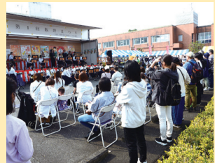
▲多くの人でにぎわう ステージイベント