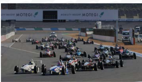
▲昨年の「スーパーFJ日本一決定戦」(モビリティリゾートもてぎ)