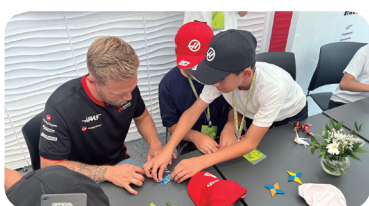
▲F1ドライバーとの交流の様子(2023年)

F1日本グランプリの開催を契機として、より多くの子どもたちが、モータースポーツを通して鈴鹿市民であることに誇りを持てるよう、F1を身近に感じることが出来る「ジュニアピットウォーク」を実施します。