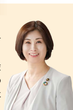
鈴鹿市長 すえまつ のりこ 末松 則子

本市が持つ魅力を最大限に生かし、また、新たな魅力を生み出しながら、市民の皆様へ寄り添った施策を展開し、最高に住みやすいと感じていただけるまちづくりを進めてまいります。