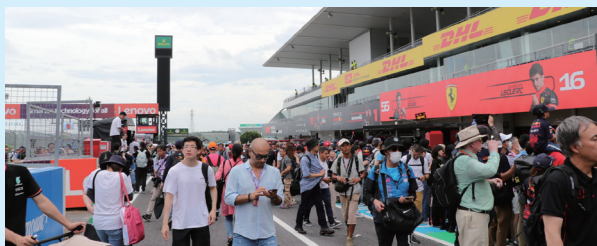
▲ピットウォークの様子(2023年)