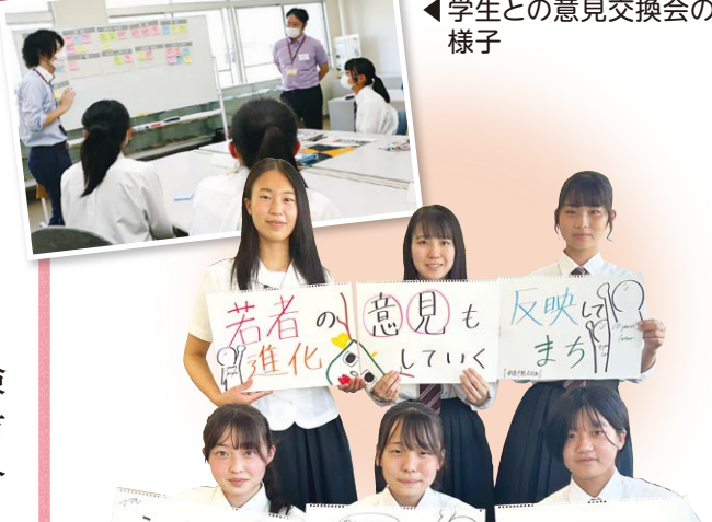
◀学生との意見交換会の様子

また、市民委員を募り、本市の将来像などを検討いただく市民委員会を行ったほか、各分野の有識者や、市民公募委員などで構成する鈴鹿市総合計画審議会を開催し、意見を反映しています。