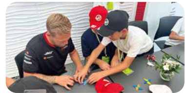
▲F1ドライバーとの交流の様子(2023年)