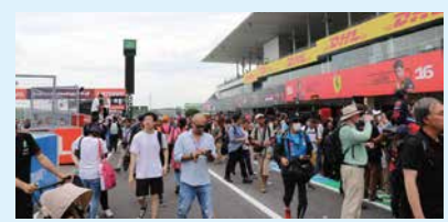
▲ピットウォークの様子(2023年)