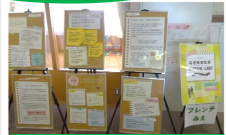
三重県男女共同参画センター フレンドみえ