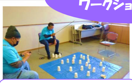
鈴鹿市 レクリエーション協会 インドアでもOK! どこでもフィッシング