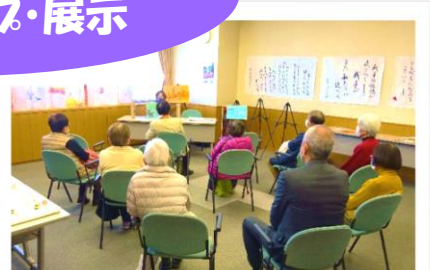
九条の会すずか なんたって、平和がいちばん！