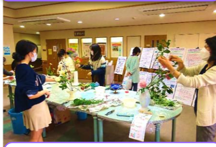
小原流鈴鹿地区 子ども教室 生け花展示発表