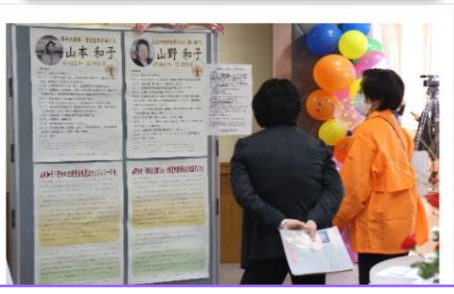
男女共同参画すずかネット 女性差別撤廃条約と鈴鹿の女性パネル展示