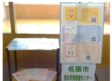
名張市男女共同参画 センター