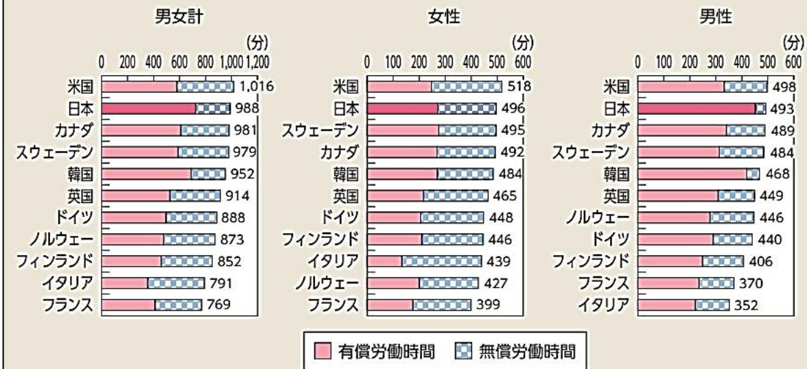
(図1) 労働時間の国際比較