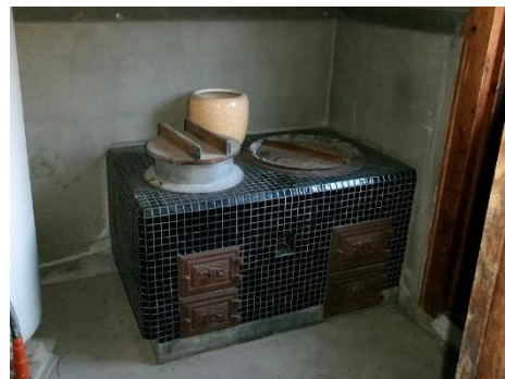
【土間 (かまど) 】