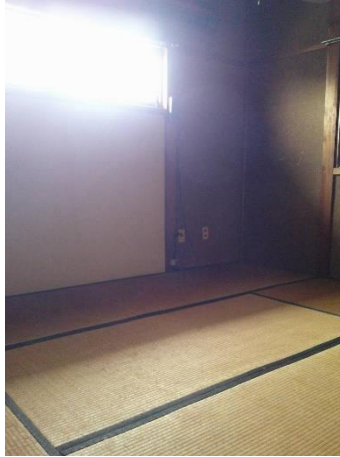
【2階 和室 (6.0畳)】