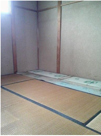
【2階 和室 (6.0畳)】