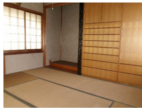
【2階 和室 (6.0畳)】