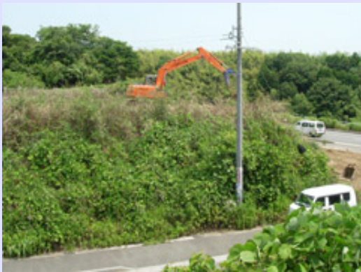
調査前風景（手前の市道が第1次調査）

まだ、調査は始まったばかりです。調査地の南側の市道部分では建設に先立ち平成9～10年に発掘調査が行われ、弥生時代後期の環濠や弥生時代から古墳時代にかけての多数の竪穴住居などが発見されています。現在遺構検出を進めているところですが、多数の竪穴住居の壁溝が複雑に切りあっているうえ、さらに中世の溝などが重なっているため、調査員は頭を抱えています。