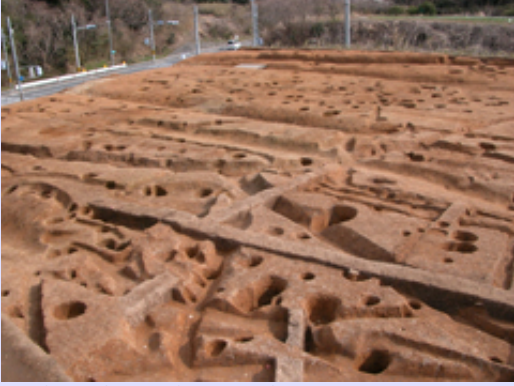
調査区全景（北から）