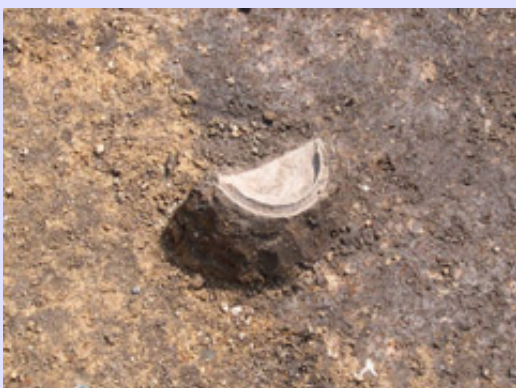
須恵器坏身の出土

個人住宅建築に伴い、掘削によって壊される浄化槽埋設部分のみのごく小規模な調査です。遺構は土坑1基と小ピットのみでした。