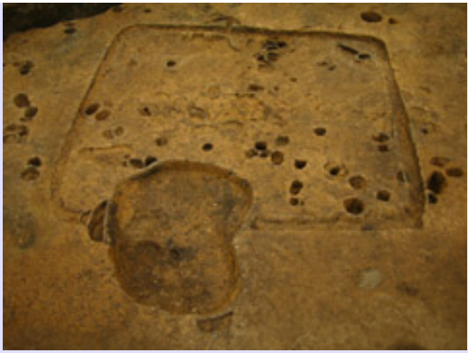
竪穴住居が掘りあがりました