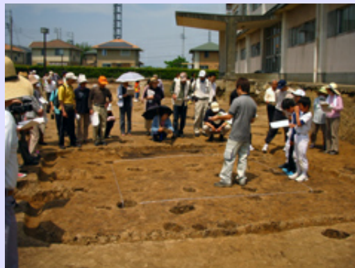
現地説明会の様子