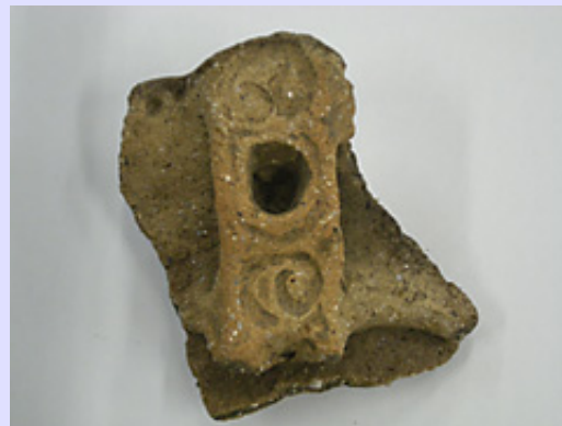
縄文土器の口縁の把手部分