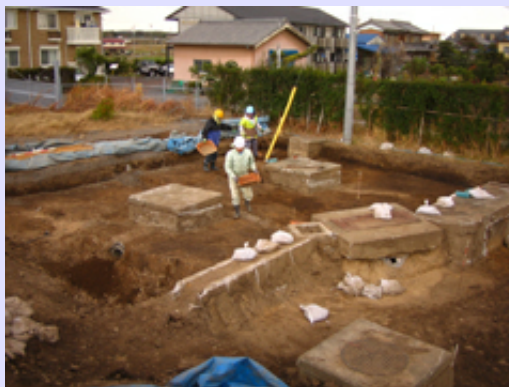
基礎や配管を避けながらの調査です。