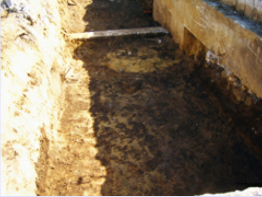
基礎よりも下から遺構面

水道施設の建て替えに伴う調査（第19次）の続きです。古い建物の取り壊しが済んだためその部分について調査を行います。建物の基礎で遺構が攪乱されていないか危惧していましたが、意外と遺構面が深く遺構の残りは良さそうです。