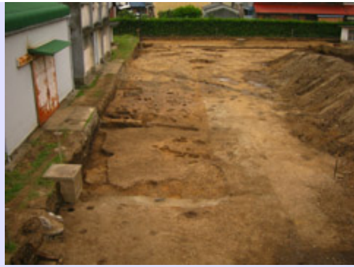
調査区東部全景（北から）