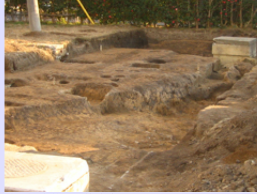
古墳時代の溝完掘