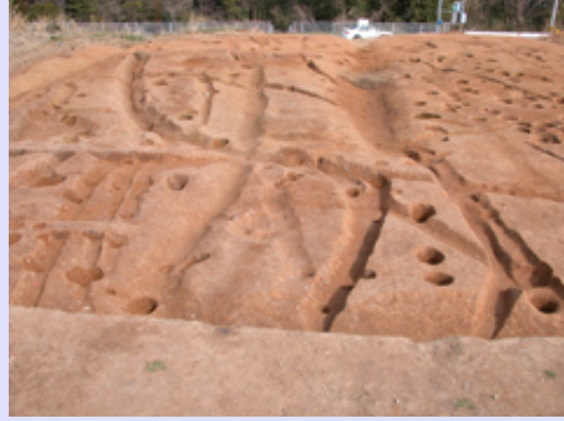
調査区北半部(西から)