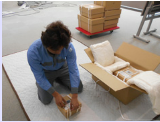
富山県の高志の国文学館へ貸し出していた伊勢国府跡の出土品が返却されました。