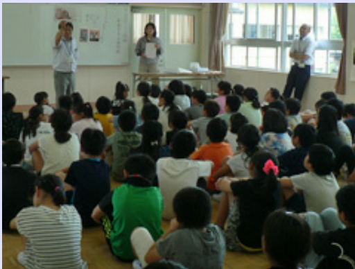
四日市市の大矢知興譲小学校に「歴史講座」と「勾玉作りの体験講座」の出前授業に出かけました。