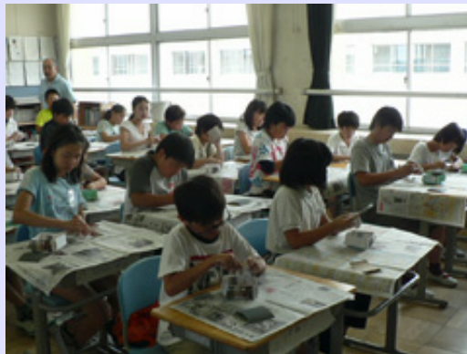
四日市市の大谷台小学校に「歴史講座」と「勾玉作りの体験講座」の出前授業に出かけました。