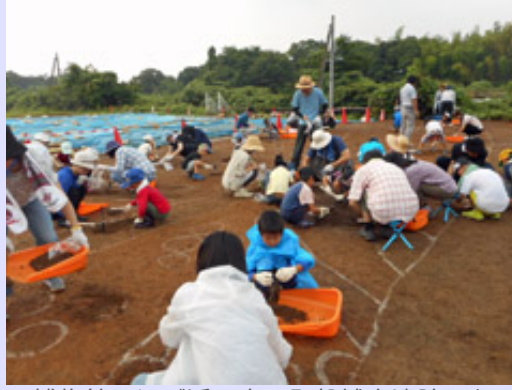
博物館にほど近い木田町磐城山遺跡において発掘調査体験会を開催しました。午前午後の2部に分かれて約100名の方に参加していただきました。