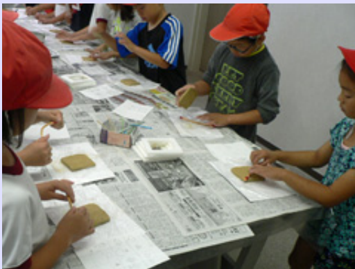
河曲小学校3年生が来館しました。縄文土器の文様を真似した縄文プレート作りを体験していただきました。後日焼成して館内で展示する予定です。