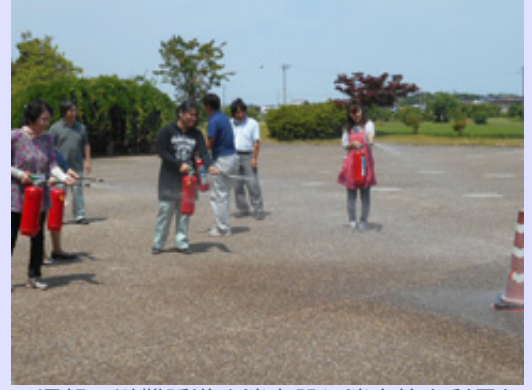
通報・避難誘導や消火器と消火栓を利用した消火訓練のほか、館内の消防設備の確認などを行いました。