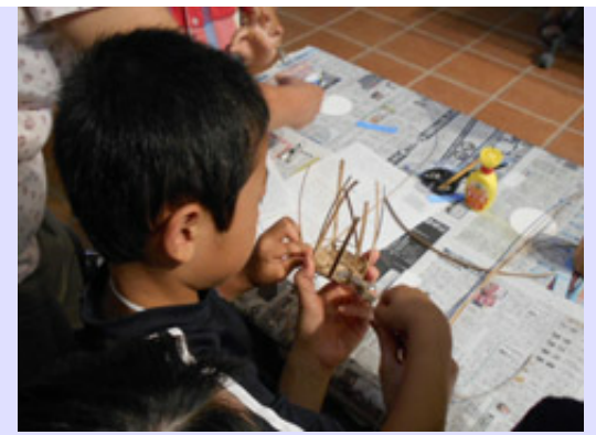
つるカゴをモチーフにした体験講座で、材料には紙バンドを使用しています。力の加減が難しく、ひと目ひと目丁寧に編んでいました。