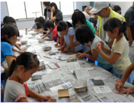
寺家育成会のイベントで勾玉作りの体験講座を開催しました。