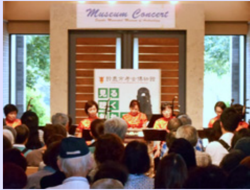
初の二胡コンサートです。会場に入りきらないほど大勢の方にご来場いただき、異国情緒溢れる音色を楽しんでいただきました。