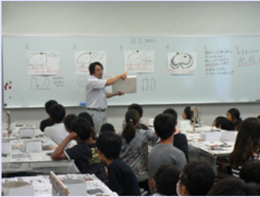
一ノ宮小学校6年生が来館しました。勾玉作りと館内の見学をしていただきました。