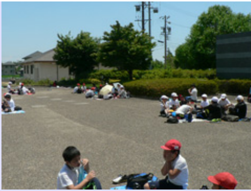
神戸小学校5年生が来館しました。勾玉づくりと館内の見学をしていただきました。