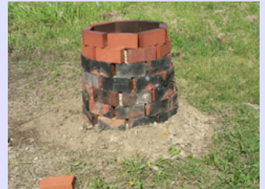
4月から再開した土笛作りとGWの土鈴の焼き上げ作業を行いました。