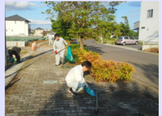
職員総出で駐車場から博物館までの歩道の除草作業を行いました。