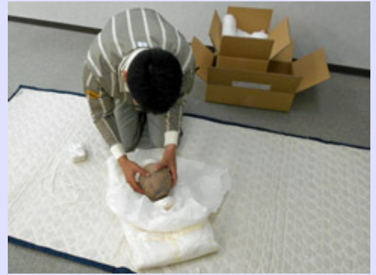
奈良県立橿原考古学研究所附属博物館へ貸し出していた上箕田遺跡出土の絵画土器が返却されました。