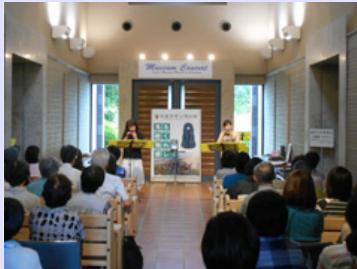
今年2回目のコンサートです。今回も大勢の方々に楽しんでいただきました。