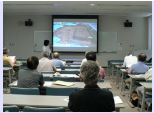
速報展の関連講座として開催するスライド説明会の2回目です。小規模の発掘調査ですが担当者がそれぞれの特徴を熱く語りました。