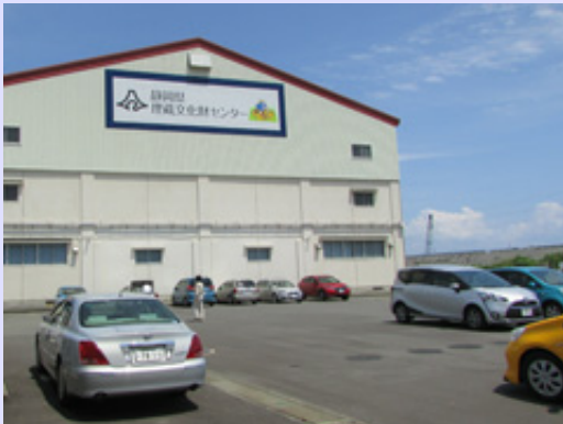
秋の特別展に向けて静岡市と静岡県の埋蔵文化財センターへ資料調査に伺い、貴重な資料を見せていただきました。