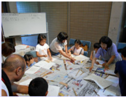
のこぎりや錐などの道具を使って、竹笛（ウグイス笛）を作りました。