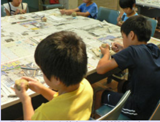
用意しておいた粘土の玉を新聞紙で包み、さらに粘土で包みます。それぞれ好きな絵や模様をつけていました。