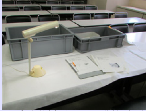
三重県埋蔵文化財センターへ資料調査に行きました。