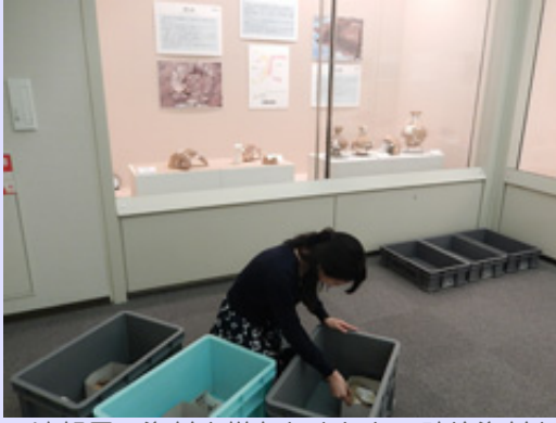
速報展の資料を撤収しました。破片資料も多いので間違えないようにもとの収蔵箱に戻しました。