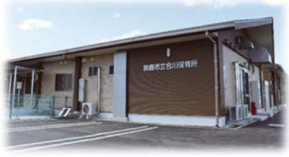
▲合川保育所(長寿命化改修) 令和5年2月竣工