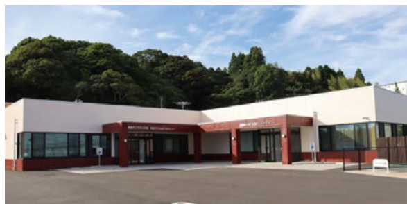
▲複合施設(天名公民館、天名地区市民センター、子育て支援センターりんりん) 令和5年11月竣工