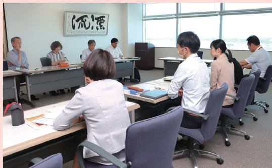
▲ワーキンググループ会議の様子

社会の変化に伴い、目標を持って学び続けることが大切と言われるようになりました。将来、社会に羽ばたく子どもたちが、それぞれの目標に向かって生きていくために、また、豊かな人生を切りひらくために、認知能力だけでなく非認知能力も一緒に育てていくことが求められています。数値化しにくいといわれる非認知能力ですが、本市では有識者を交えたワーキンググループ会議などを行い、児童・生徒へのアンケートなどを通して「見える化」する方法を探っているところです。