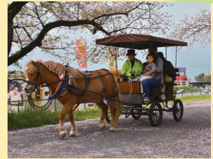
▲馬車に乗ってお花見