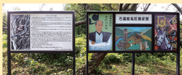
▲冊子と史跡看板(上田岩)

史跡などが多くある石薬師地区の歴史を伝えるため、冊子を作成し全戸に配布しています。